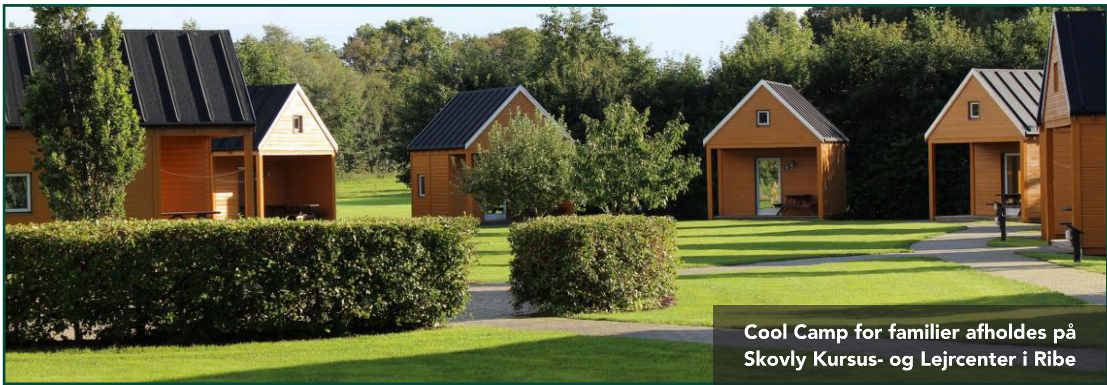
Cool Camp for familier afholdes på Skovly Kursus- og Lejrcenter i Ribe